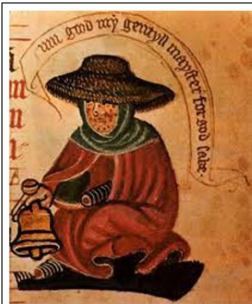
Melaatse met sy klok

Nadat die begraafplaas se stof op die melaatse se kop gestrooi is, het die priester hom herinner aan die reëls wat vir melaatses gegeld het: Hulle kon nie die huis verlaat nie tensy hulle 'n duidelike grys mantel gedra het en met 'n klokkie of 'n houtklapper ("clapper" of "ratchet") 'n geraas gemaak het om ander mense te waarsku.