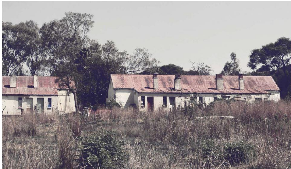
Illustration 1: Housing complex at Fort West in Pretoria West.

Die plek is vandag bekend as Westfort; vernoem na een van Pretoria se ou forte, naamlik Fort Daspoostrand, ook bekend as Fort West, wat op die terrein opgerig is.