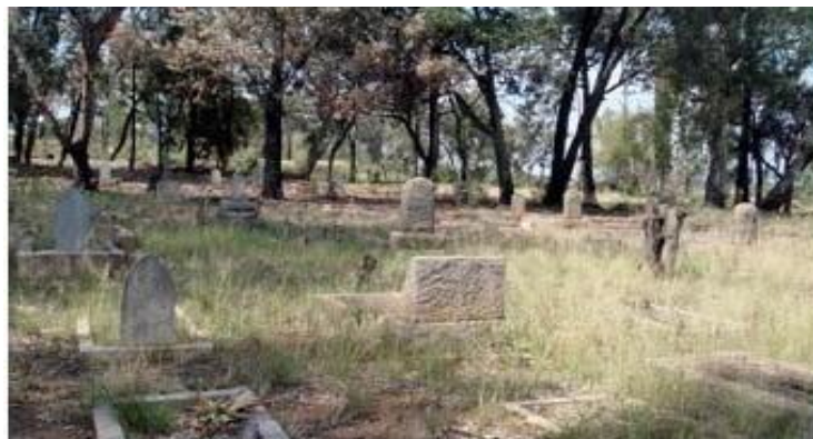
Een van die Begraafplase by Westfort