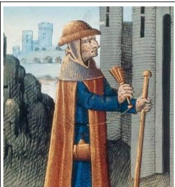
Melaatse met sy klapper

Hulle is verbied om kermisse, markte, meulens en plase te besoek en om Assisi binne te gaan. Hulle kon slegs om kos bedel as hulle handskoene gedra het en 'n bak gebruik het om die aalmoese in te ontvang. Hulle is verbied om direk uit fonteine, riviere en putte te drink; hulle kon net uit hulle eie flesse drink. As hulle met gesonde mense gepraat het, moes hulle wind af van hulle staan (Bronne 5 en 6).